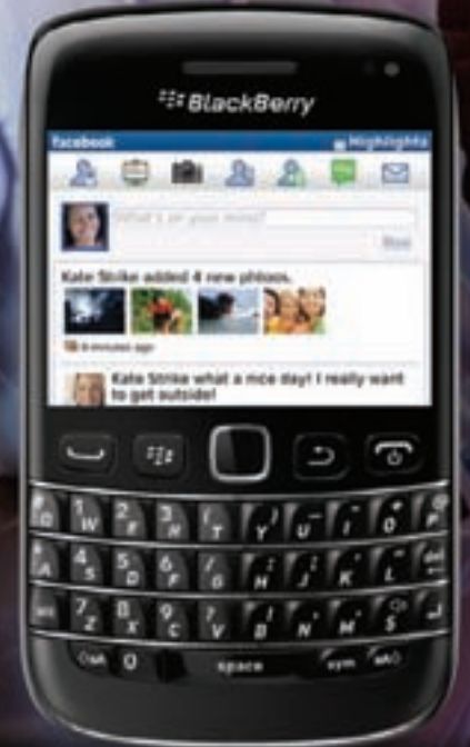
BlackBerry® Bold™ 9790